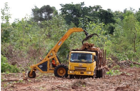
Machine maalum ikipakia magogo kwenye lori kupeleka kiwandani

Mkandarasi wa usafirishaji, Master one mwenye malori 8 ameajiriwa na KVTC kusafirisha magogo kutoka msituni hadi kiwandani. Kila lori lina uwezo wa mita za ujazo 13 za magogo. Malori hupakiwa kwa kutumia mashine ya Bell (mali ya KVTC).