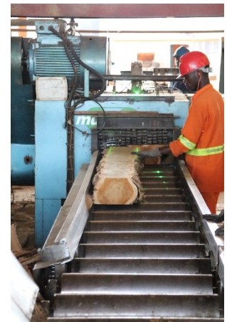
Mashine ya kuchakata mbao