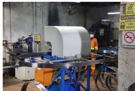
Mashine ikinoa misumeno