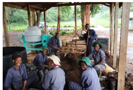
Ujazaji wa vitalu vya miche