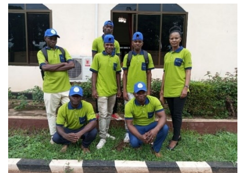
Wafanyakazi bora wa mwaka 2022