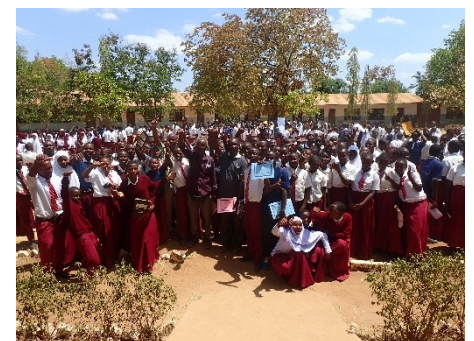
Washiriki wa Mashindao ya uchoraji 2022 - Shule ya Sekondari ya Iragua