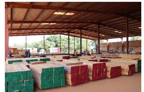
Stoo ya bidhaa za mbao tayari kwa mauzo